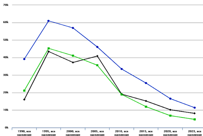
Диаграмма. Число умерших с 1990 по 2023 годы в Российской Федерации по причинам убийства, самоубийства и случайных отравлений алкоголем